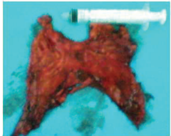
Figure 2 : Pièce opératoire de thymectomie pour hyperplasie thymique

Tous les patients ont été opérés. La voie d'abord était une sternotomie médiane totale. A l'exploration chirurgicale du médiastin antérieur, on retrouvait une augmentation diffuse et homogène de la taille du thymus sans masse focale palpable chez les patients n°1, n°2, n°3 et n°4. La taille de la glande était normale la patiente n°5. Une thymectomie totale était réalisée chez tous les patients. La Figure 2 illustre une pièce opératoire de thymectomie.